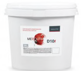
ШПАКЛЕВКА ДЛЯ СТЫКОВ